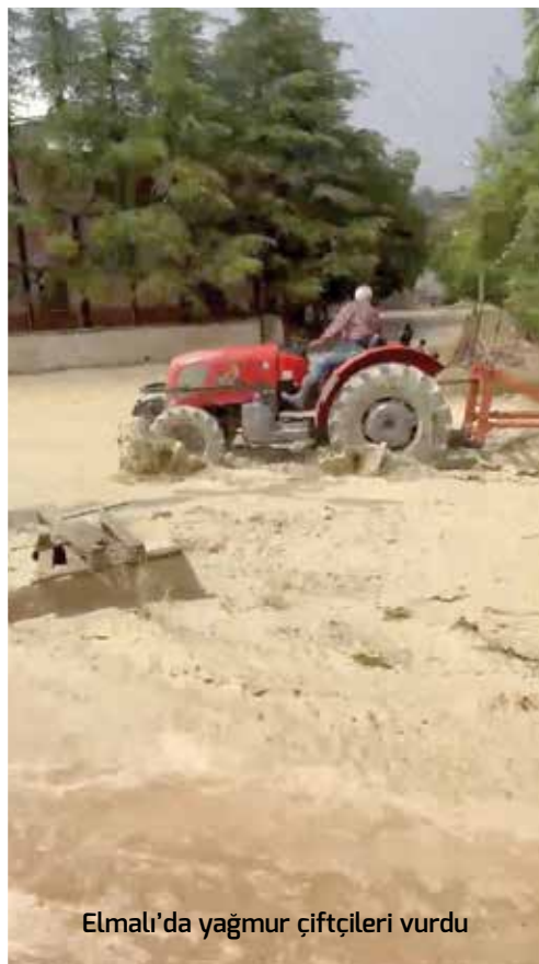
Elmalı'da yağmur çiftçileri vurdu