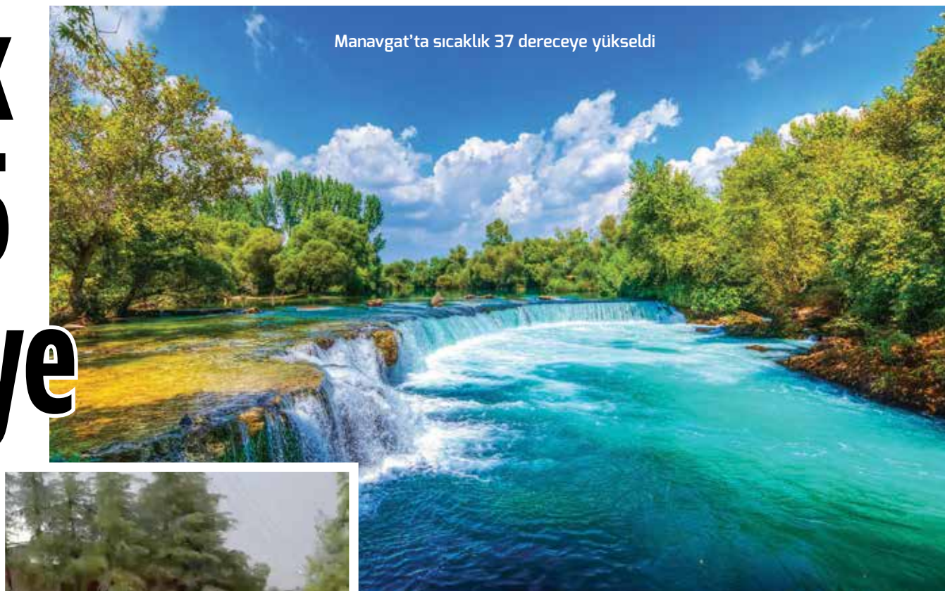
Manavgat'ta sıcaklık 37 dereceye yükseldi

ANTALYA'DA son günlerde etkisini sürdüren bunaltıcı sıcak hava, yerini yağışlı ve serin havaya bıraktı. Geçtiğimiz hafta kent genelinde hissedilen sıcaklık 45 dereceye kadar yükselirken, hafta sonu itibarıyla özellikle yüksek kesimlerde etkili olan sağanak yağışlarla birlikte hava sıcaklıklarında dikkat çekici bir düşüş yaşandı. Elmalı ilçesinde bulunan orman sahasında termometreler temmuz ayında 12