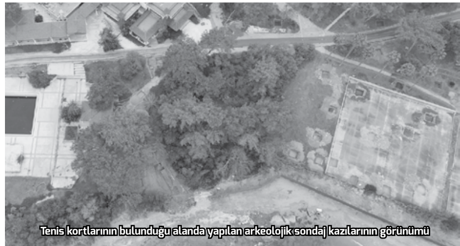
Tennis kortlarının bulunduğu alanda yapılan arkeolojik sondaj kazılarının görünümü

Uzmanlara göre sınırları henüz ortaya çıkarılmamış olan ve çok büyük bir kısmı toprak altında olduğu düşünülen İdyros antik kentinde yapılması gerekenler şöyle sıralanıyor: Ağır iş makineleri acilen alan dışına çıkarılmalı, inşaat faaliyetleri ve altyapı çalışmaları tümüyle durdurulmalı ve alanda yapılacak bütüncül bilimsel değerlendirmeler sonuçlanıncaya kadar fiziki müdahalelere son verilmeli. ■ YUSUF YAVUZ