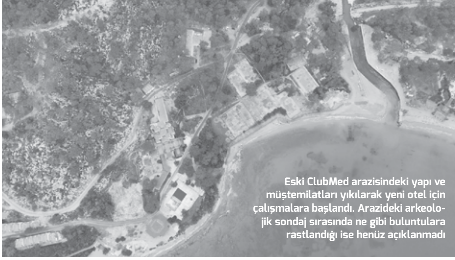
Eski ClubMed arazisindeki yapı ve müstemilatları yıkılarak yeni otel için çalışmalara başlandı. Arazideki arkeolojik sondaj sırasında ne gibi buluntulara rastlandığı ise henüz açıklanmadı

Antalya'nın önemli turizm merkezlerinden biri olan Kemer ilçesindeki ünlü Ayışığı koyunun bitişiğindeki orman arazisi 2068 yılına kadar Özak GYO'ya devredildi. Daha önce burada bulunan