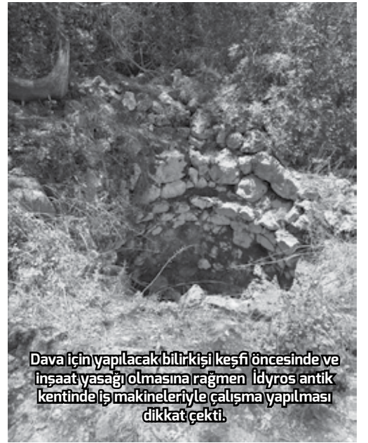
Dava için yapılacak bilirkişi keşfi öncesinde ve inşaat yasağı olmasına rağmen İdyros antik kentinde iş makineleriyle çalışma yapılması dikkat çekti.

Türk turizminin en önemli cazibelerinden biri olan arkeolojik ve kültürel mirasın, Kemer İdyros antik kenti örneğinde koruma ile kullanma dengesi arasında sıkışıp kaldığına işaret ediyor. 2014 yılında Phaselis antik kentinde RIXOS grubu tarafından 5 yıldızlı bir otel inşa