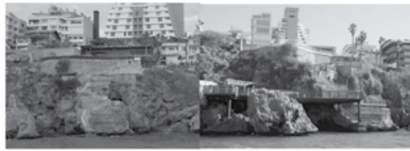
Sekil 8. Ramada Otel önündeki 1. Derece SİT alanında olmaması gereken yapay eklentiler.

Raporda, 8 Nisan 2026'da koruma statüsü düşürülen falez bandı incelendiğinde 3 lokasyon haricinde kalan yerlerin doğal yapısının korunduğu kaydedildi. Doğal, estetik, nadirlik, hassasiyet ve bilimsellik parametrelerinden 10 üzerinden 10 puan aldığı da kaydedilen raporun sonuç kısmında, şu ifadelerle yer verildi: "Adalar Plajı güneşlenme platformları, Perge Otel güneşlenme platformları ve diğer yapılar, Ramada Otel güneşlenme platformları, yüzme havuzu ve diğer yapılar yıkılarak falezlerin doğal haline dönüştürülmesinin sağlanması gerekirdi. Söz konusu tahribatlar ortadan kaldırıldığında, gerek duyulursa restorasyon yapıldıktan sonra doğa kısa sürede bu alanı eski doğal haline dönüştürecek ve bu 3 nokta haricindeki diğer kesimlerde olduğu gibi Kesin Korunacak Hassas Alan olarak korunmasının sağlanması mümkün olabilecektir. Sonuç olarak; Karalioğlu Parkı önündeki falezlerin koruma statüsünün düşürülmesi kararının geri alınması ve Kesin Korunacak Hassas Alan olarak ilan edilmesinin bilime ve arazi koşullarına uygun olacağı kanaatine varılmıştır." ■ DHA