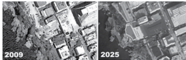
Sekil 9. Ramada Otel önünde falez yüzünde inşa edilmiş yüzme havuzu.