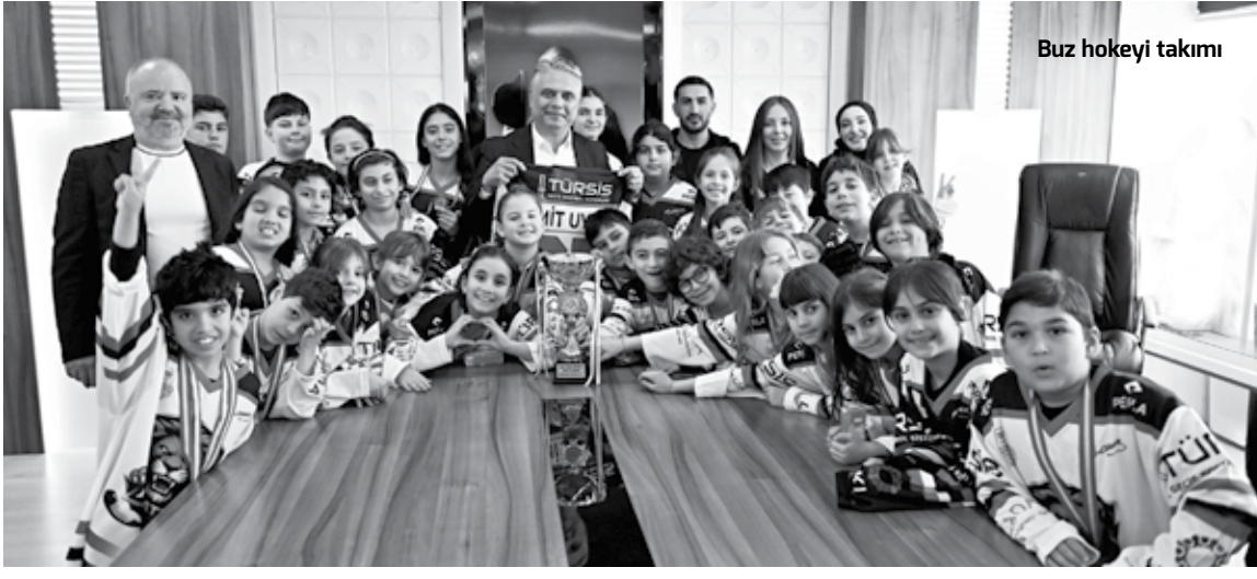
Buz hokeyi takımı