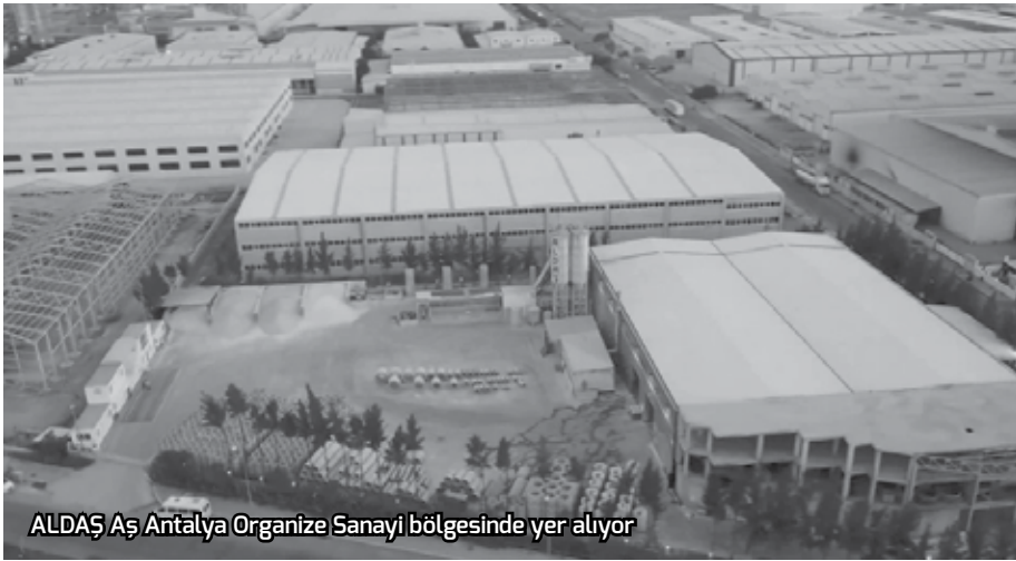
ALDAŞ AŞ Antalya Organize Sanayi bölgesinde yer alıyor

seyahat, konaklama, temsil ve ağırlama gibi gider kalemleri yer alıyor. Birlikli raporunda, ADAŞ çalışanları ile bazı kamu görevlileri ile aynı odada konaklayan yabancı uyruklu bazı kadınların konaklama bedellerinin de ALDAŞ'a fatura edildiği tespitine yer veriliyor. Bu kapsamda konaklama ve lüks restoranlardaki yemek faturaları dâhil ALDAŞ'ın ödediği paraların toplamının 63 milyon üzerinde olduğu tespit edilmişti. Antalya Büyükşehir Belediyesi şirketi olan ALDAŞ'daki usulsüz işlemler nedeniyle oluşturulan kamu zararları nedeniyle, 5 Temmuz 2025 tarihindeki operasyonun ardından tutuklanarak cezaevine konulan ve görevden uzaklaştırılan Büyükşehir Belediye Başkanı Muhtittin Böcek için yeni bir tutuklama kararı daha çıkmıştı.