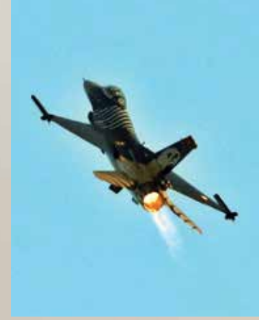
SOLO TÜRK F-16 gösteri ekibi de nefes kesen bir gösteri gerçekleştirecek. Antalya Valiliği

Kutlamalar kapsamında 23 Nisan Perşembe günü Konyaaltı sahilinde saat 17:00'de