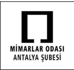
MİMARLAR ODASI ANTALYA ŞUBESİ