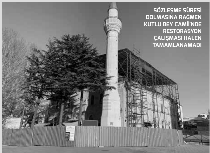
SÖZLEŞME SÜRESİ DOLMASINA RAĞMEN KUTLU BEY CAMİ'NDE RESTORASYON ÇALIŞMASI HALEN TAMAMLANAMADI