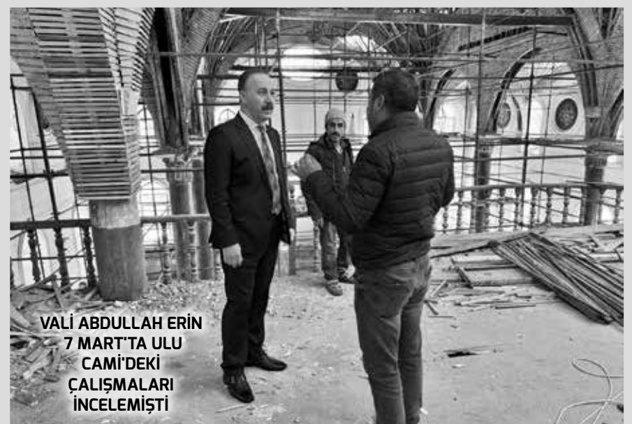
VALİ ABDULLAH ERİN 7 MART'TA ULU CAMİ'DEKİ ÇALIŞMALARI İNCELEMİŞTİ

Antalya Vakıflar Bölge Müdürlüğü'nün 13 milyon 560 bin TL bedelle Akçaylar Restorasyon adındaki özel şirkete ihale ettiği restorasyon projesinin sözleşme tarihi 20 Şubat 2023. Toplam 600 günde tamamlanacağı açıklanan Restorasyon projesinin, sözleşmeye göre 25 Mart 2025 tarihinde bitirilmesi gerekiyordu. Ancak tarihi cami ve çeşmesini