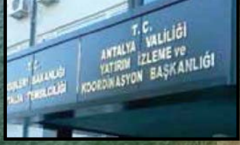
Antalya YİKOB ikinci şirketini kurdu

■ ANTALYA YİKOB bünyesinde kurulan ikinci şirketin iştiğal alanları arasında; yabancılara yönelik mülk satışı ile her türlü gayrimenkul alım satımının yanı sıra otel, plaj, diskotek, bar ve nargile salonu iştiğal etmek de yer alıyor. Valilik şirketinin iştiğal alanında neredeyse yok yok... ■ 6'DA