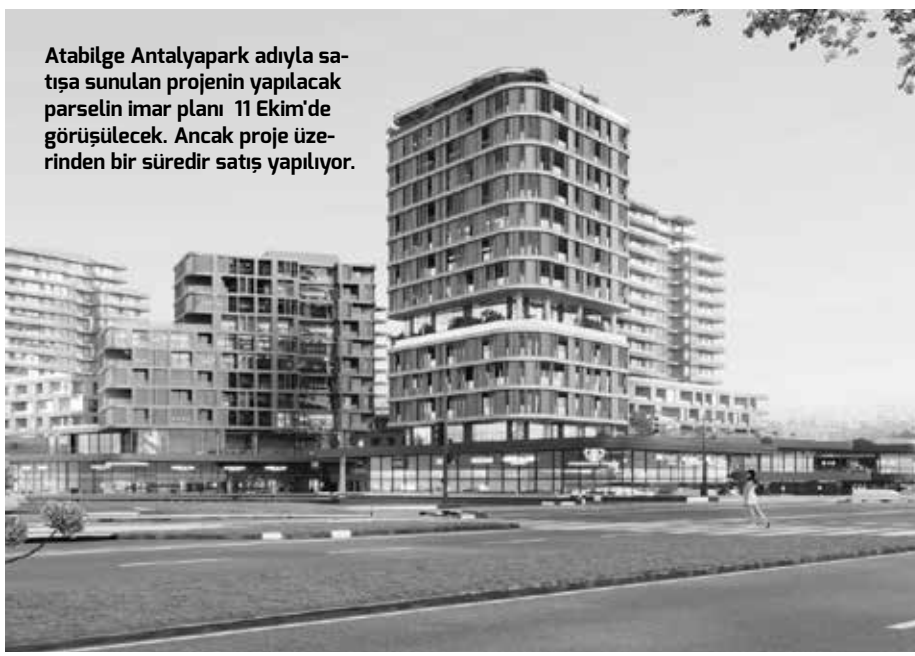
Atabilge Antalyapark adıyla satışa sunulan projenin yapılacak parselin imar planı 11 Ekim'de görüşülecek. Ancak proje üzerinden bir süredir satış yapılıyor.

Antalya'da kent gündeminde tartışmalara neden olan KİPA AVM arazisindeki imar değişikliği yargıya taşınıyor. Ekim 2024 tarihinden bu güne hem Antalya Büyükşehir Belediyesi'nin hem de Kepez Belediyesi'nin meclis toplantılarının gündemine gelen ve her iki mecliste de onaylanan imar planı değişikliği talebi, Ankara merkezli bir inşaat firmasının rezidans projesi yapmak istediği parseli kapsıyor. İmar planı onaylanmadan aylar önce pro-