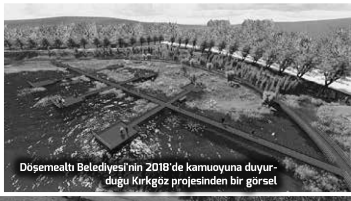
Döşemealtı Belediyesi'nin 2018'de kamuoyuna duyurduğu Kırkgöz projesinden bir görsel

Antalya'nın içme suyu kaynaklarından biri olan Döşemealtı ilçesindeki Kırkgöz'de ilçe belediyesi tarafından yürütülen çalışmanın nedeni belli oldu. Döşemealtı Belediye Başkanı Menderes Dal, koruma altındaki Kırkgöz'de görüntülen hafriyat kamyonlarının, bu alanda yürütülen rekreasyon projesi için çalışma yaptığını açıkladı. Kırkgöz'deki eski yapıların restore edilerek hizmete açılacağını da dile getiren Belediye Başkanı Dal, "burada çimlendirme yaparak yeşil alan oluşturacağız. Halkımızın kullanımına açacağız" ifadelerini kullanırken Biyomühendis-Yazar Hüseyin Çağlar İnce ise sadece Antalya'nın değil, tüm Türkiye ve dünyanın su kıtlığına doğru gittiğine işaret ederek Kırkgöz su kaynağına yapılan müdahalenin kabul edilemez olduğunu dile getirdi.