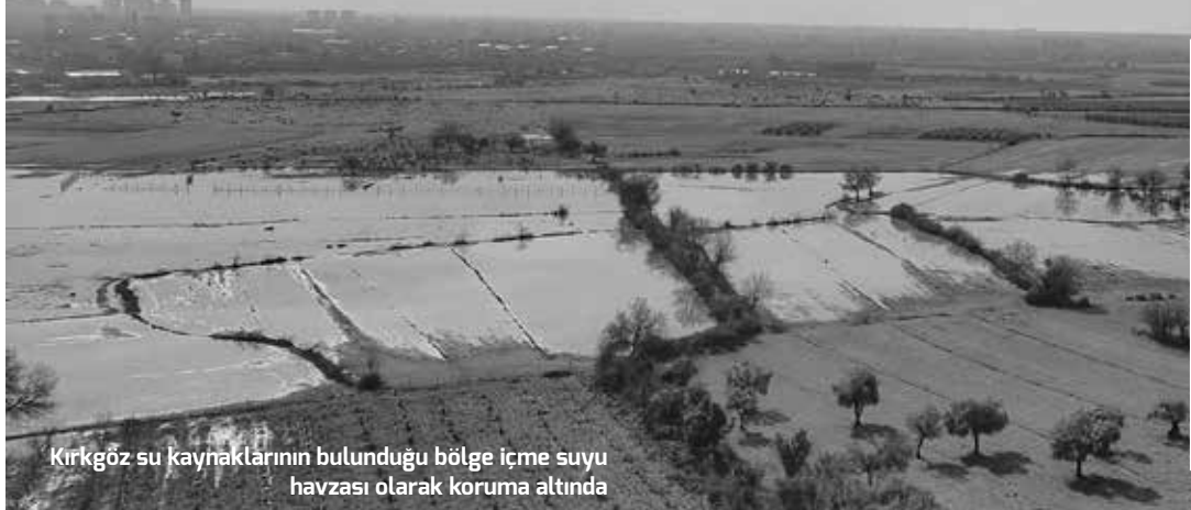
Kırkgöz su kaynaklarının bulunduğu bölge içme suyu havzası olarak koruma altında