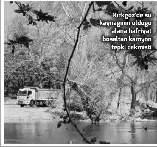
Kırkgöz'de su kaynağının olduğu alana hafriyat bosaltan kamyon tepki çekmişti

Döşemealtı Belediye Başkanı Menderes Dal, koruma altındaki Kırkgöz'de görüntülen hafriyat kamyonlarının, bu alanda yürütülen rekreasyon projesi için çalışma yaptığını açıkladı. Biyomühendis Hüseyin Çağlar İnce, "Ülkenin dört bir yanında doğal alanlar yok edilirken, bizim 'rekreasyona' değil, ekolojik restorasyona ihtiyacımız var" dedi.