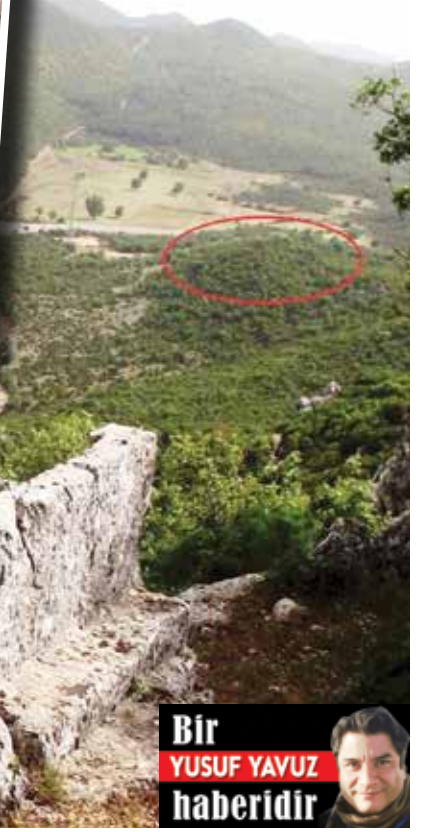
Bir YUSUF YAVUZ haberdirdir

✓ Eski Kültür ve Turizm Bakanı Ertuğrul Günay, Demre-Kaş-Kalkan otoyol projesini değerlendirdi. Günay, "Projeye baktım ve çok sayıda ağaç kesiliyor. Bu güzergahta antik kentler ve bir de nekropol var. Ankara'da oturup proje yapanlar bu ülkeye katkı yapmıyor, zarar veriyorlar." dedi