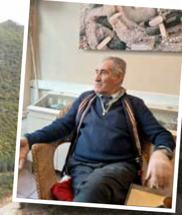
Eski Kültür ve Turizm Bakanı Ertuğrul Günay