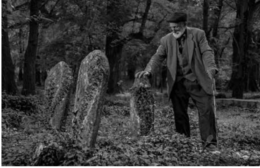
mezar taşı (Şahide) yer alıyor.

Antalya'nın İbradı ilçesinde koruma altındaki mezarlıkta bulunan kestane ağacının kesilmesi tepki çekti. 1700'lü yıllardan kalma Osmanlı dönemi mezar taşlarını barındıran tarihi mezarlıkta 227 Anadolu kestanesi (Castanea sativa) ağacı bulunuyor. Anıtsal nitelikteki kestane ağaçlarının yoğun olduğu mezarlık, tür için adeta gen merkezi niteliğinde. İbradı Mezarlığı'ndaki kestane ağacının bir açıklama yapılmadan kesilmesi vatandaşların tepkisini çekerken, Antalya Büyükşehir Belediyesi yetkilileri ağacın kuruduğu için kesildiğini söyledi. İbradı'daki tarihi mezarlık barındırdığı Osmanlı dönemi mezar taşları nedeniyle 1981 yılında koruma altına alındı. Tarihi mezarlıkta 18. yüzyıldan kalma Osmanlı dönemine ait mezar taşları bulunuyor. 2012 yılında koruma sınırları güncellenerek Kentsel Sit Alanı içerisinde kalan tescilli mezarlıkta Ormanlı dönemi yönetici sınıfı ve ulemaya ait 116 adet kitabeli