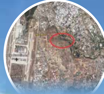
Antik yolun bulunduğu bölge havaalanının doğusunda yer alıyor

Antik yolun kuzeye bakan bölümü. Kırmızı çizginin olduğu bölgeye kadar hafriyat döklüldüğü belirtiliyor.