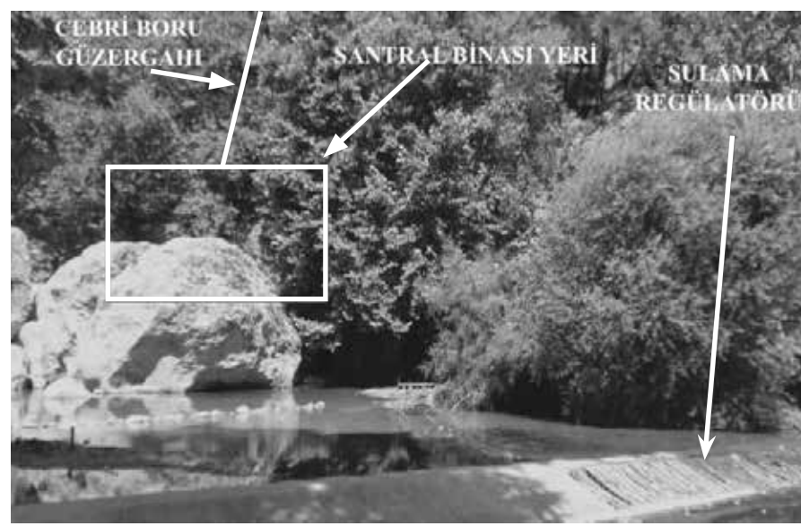
CEBRI BORU GÜZERGAHI