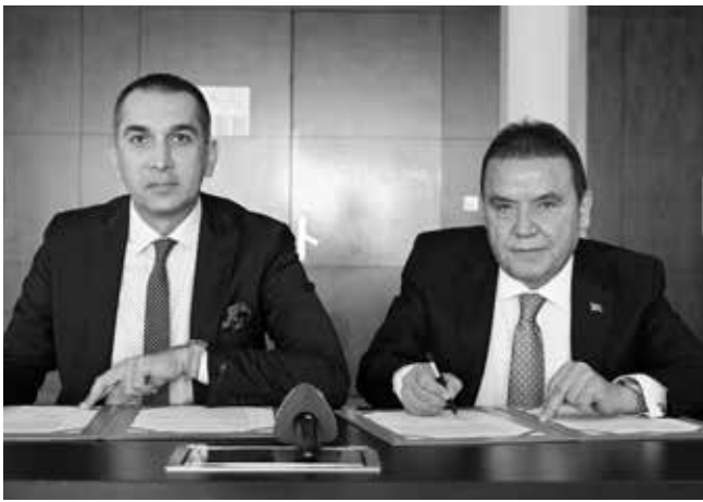
zenlenmesi planlanan İklim Değişikliği Zirvesi, kentin yerel yönetim çalışmaları

ZİRVE İLE YOL HARİTASI OLUŞTURULACAK Protokol kapsamında 16 Ekim'de dü-