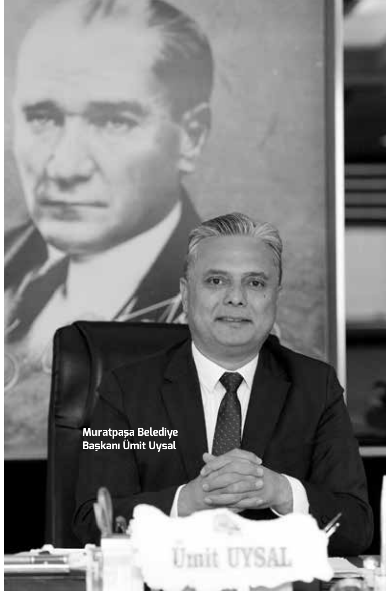
Muratpaşa Belediye Başkanı Ümit Uysal

Muratpaşa Belediye Başkanı Ümit Uysal, sosyal medya hesabından yaptığı açıklama ile CHP genel başkanlığına aday olabileceğinin sinyalini verdi. Uysal, "Türkiye'mizi yeniden inşa etmek üzere 32 yıllık siyasi birikimimi partimin hizmetine sunacağımı kamuoyunun bilgisine sunarım." dedi