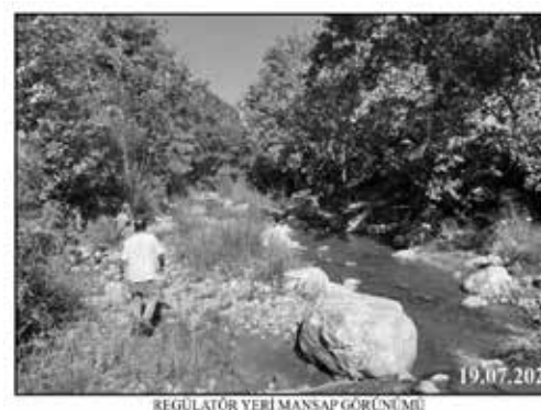
REGÜLATÖR YERİ MANSAP GÖRÜNÜMÜ

HES santral binası için seçilen yer, dere vadisinin düzlüğe inmeye başladığı bölge. Doyran mezarlığı ve DSİ'nin inşaat ettiği gölete çok yakın bir noktada yer alıyor. Yeni bir HES projesi, tankerle çobanların yaylaya su çıkardığı bölgede yeni su krizine yol açabilir. HES'ler Türkiye için enerjide dışa bağımlılıktan kurtuluşun reçetesi gibi sunuldu ancak inşaat süreçleri bir yıkıma dönüştü. ÇED dosyaları 'kopyala yapıştır'