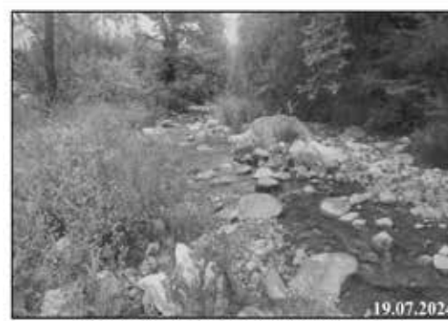
REGÜLATÖR YERİ MANSAPINDA DOYRAN DERE GÖRÜNÜMÜ