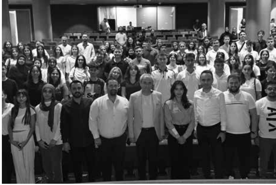
Antalya'daki en büyük spor okulumuz biliyorsunuz Kepez'de. Spor okulunda 6 binin üzerinde, 12 branşta çocuk ve

Kepez'de yapılacak projelere değişen Başkan Kocagöz, öğrenciler için geçici barınma evi, yine öğrenciler için lokantalar, çamaşırhaneler, ortak buluşma alanları(OBA) yapacaklarını, internet, sosyal yardım ve burs desteği sağlayacaklarını sözlerine ekledi. Bir öğrencinin daha fazla spor alanları isteği üzerine; "Kepez Turgut Özal Spor Salonu'nun yapımında katkılarım oldu. Şu anda Gençlik Spor İl Müdürlüğü ile ortak projeye 3 spor salonu açıyoruz. Daha büyük bir spor salonu içinde çalışmalarımız devam ediyor.