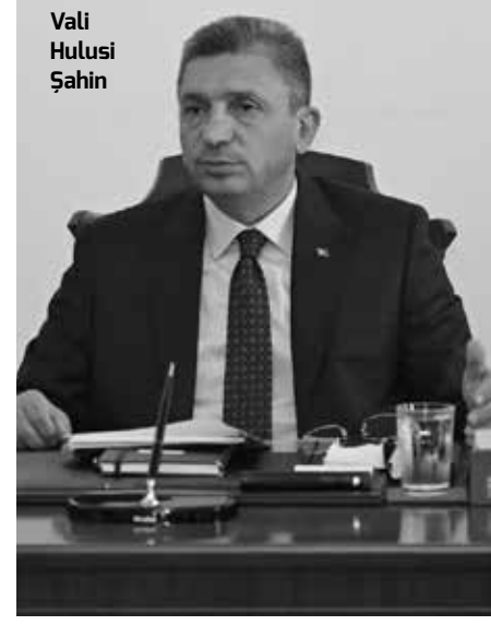
Vali Hulusi Şahin

Denetim Toplantısı gerçekleştirmiştik. Bu toplantılarda Kaleiçi'nin altyapı yetersizlikleri, çevresel sorunları, estetik kaygıları ve trafik yoğunluğu gibi sorunlarına yönelik düzenlemeleri belirlemek üzere çalışma grupları oluşturduk. Bugün gerçekleştireceğimiz Kaleiçi Estetik Toplantımızda ise, uygulamaya koyduğumuz kararların ne aşamada olduğunu ve Kaleiçi'nin estetik yapısı ile ilgili sorunlara yönelik düzenlemeleri değerlendireceğiz" dedi. Kaleiçi'yle ilgili kurum ve kuruluşların yetkililerinden sorumluluk alanlarıyla ilgili bilgi ve çözüm önerilerini de alan Vali Hulusi Şahin, ilgililerin hazırlayacağı raporların ve yapılan çalışmaların değerlendirileceği çözüm odaklı toplantıların devam edeceğini belirtti. ■ ERTUĞRUL GÜN