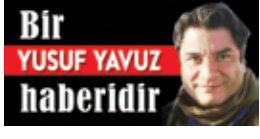
Bir YUSUF YAVUZ haberidir

Kaş'a bağlı Çamlıova Mahallesi'nde sedir ağaçlarıyla kaplı 100 hektarlık orman arazisinde, özel bir şirkete 2 yıl önce mermer ocağı ruhsatı verildi. Orman Bölge Müdürlüğü olumsuz görüş bildirince ÇED süreci durduruldu. Ancak şirket, proje alanında değişikliğe giderek yeniden ÇED başvurusu yaptı. Çevre, Şehircilik ve İklim Değişikliği Bakanlığı ise projeye ilgili ÇED toplantısı yapılmasına karar verdi.