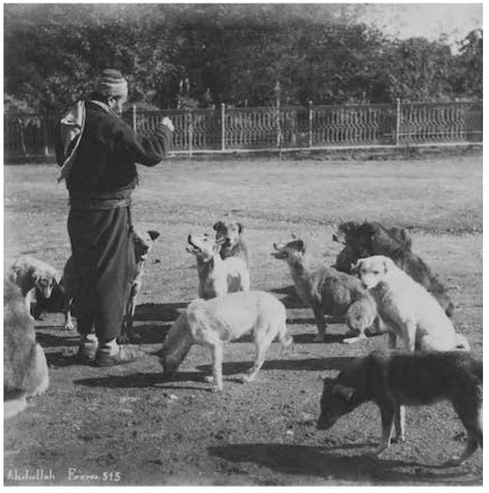
Abdülhamid Emiri, 1915

Avrupa'da soyluların av köpeği merakı bir statü göstergesiydi. Bu görsel, Sultan II. Abdülhamid'in emriyle oluşturulan Yıldız Albümlerinden. Bu albümlerde,