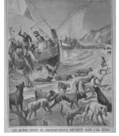
LES 40.000 CHIENS DE CONSTANTINOPLE REPORTÉS DANS L'ILE D'AS