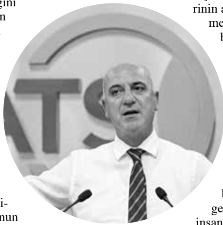
Bakanlığının yurtdışı ziyaretlere yönelik verdiği desteklerden yararlanmaya davet ediyor-

Turist sayısında kesin bir yükseliş yaşandığını belirten Başkan Bahar, "Geçen yıl 16 milyona yaklaşan yabancı ziyaretçi sayısı ile rekor kırdık. 2023'te, İstanbul, Londra ve Dubai'den sonra Antalya, dünyada en fazla yabancı ziyaretçi çeken dördüncü şehir oldu. 2024'te turist sayımız daha da artacak. Beklenmediği bir gelişme olmazsa 2025'te de başarılı bir sezon bekliyoruz.Antalya Havalimanında yeni bir rekor kırıldı.22 Haziran Cuma günü 199 bin 751 yolcu ve bin 175 uçak trafiği ile yılın en yüksek uçuş ve yolcu sayılarına ulaşıldı. Başarıların yanında sektörde önemli sorunlarımız devam ediyor. Özellikle animasyon ve eğlence sektörü, spa-hammam, seyahat acenteleri ve konaklama sektöründe faaliyet gösteren komitelemizin, yabancıların çalışma ve oturma izinleri konusunda sıkıntılar yaşadığını biliyoruz" dedi. ■ ERTUĞRUL GÜN