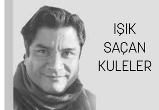
İŞIK SAÇAN KULELER

Minare kelimesinin kökeni, Arapça 'menâre' kelimesine dayanıyor. Işık ve ateş çıkan yer anlamına geliyor. Sırasıyla 9. ve 10. yüzyıllarda kurulan Türk devletleri olan Karahanlılar ve Gaznelilerin mimarisinde minarelerin ayrı bir yeri vardır.