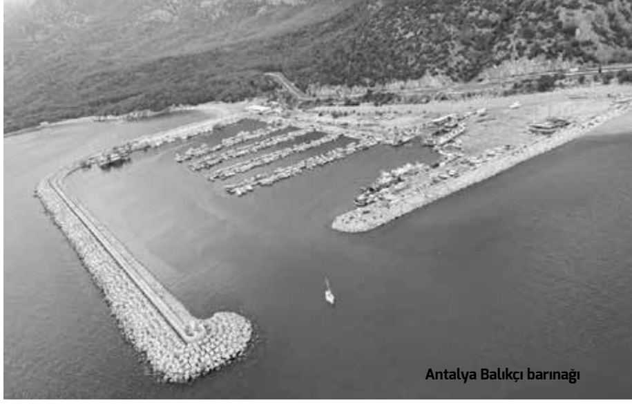
Antalya Balıkçı barınağı

Antalya'nın Konyaaltı ilçesi, Topçam Mevkii'nde bulunan Balıkçı Barınağı'nın sözleşme süresi dolmadan iki ayrı su ürünleri kooperatifine üye balıkçıların barınaktan çıkarılmak istenmesi son aylarda kentteki balıkçıların en önemli gündemiydi. Konuyla ilgili iddialar arasında, kent merkezine yakın olan sahilde yer alan balıkçı barınağının yapılacak