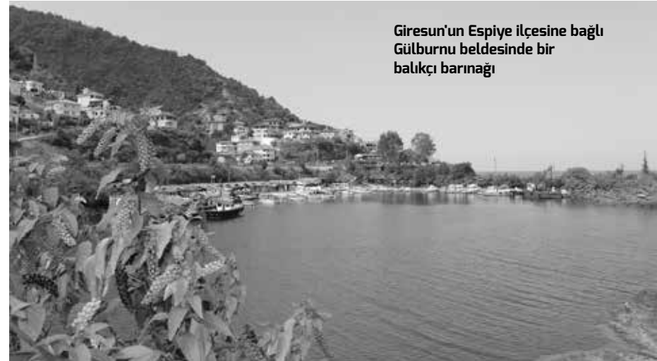
Giresun'un Espiye ilçesine bağlı Gülburnu beldesinde bir balıkçı barınağı