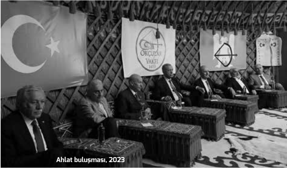
Ahlat buluşması, 2023