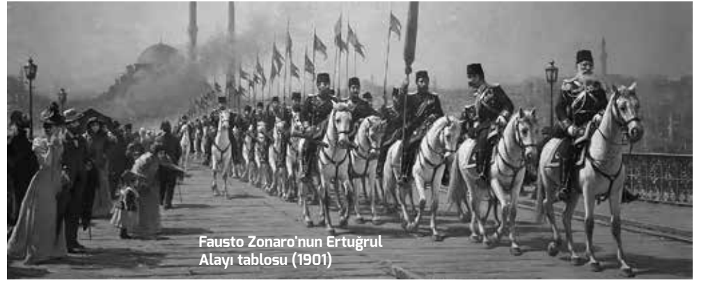
Fausto Zonaro'nun Ertuğrul Alayı tablosu (1901)