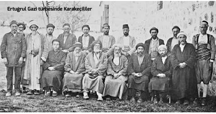
Ertuğrul Gazi türbesinde Karakeçililer