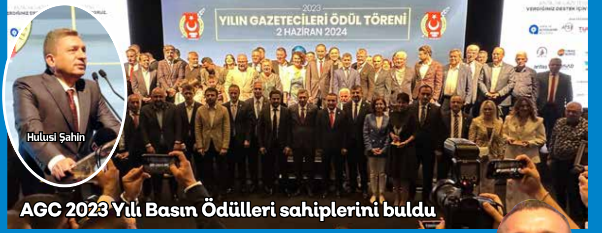
AGC 2023 Yılı Basın Ödülleri sahiplerini buldu