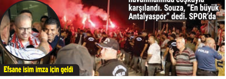
Efsane isim imza için geldi

Süper Lig ekiplerinden Antalyaspor'un gelecek sezon teknik direktörlüğünü yapacak olan Alex de Souza, akşam saatlerinde havalimanında coşkuyla karşılandı. Souza, "En büyük Antalyaspor" dedi. SPOR'da