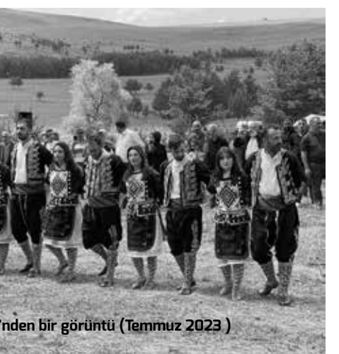
Gölü Kaşar Festivali'nden bir görüntü (Temmuz 2023)

Geçtiğimiz ay yöre halkıyla bir araya gelerek projenin yaratacağı riskler hakkında panel düzenlendiği bilgisini veren Işık, altın ve bakır madeni işletmesinin açılması durumunda bölgedeki hayvan-