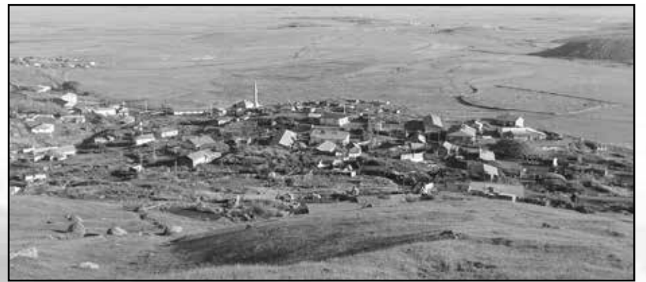
Ardahan Gölü ilçesine bağlı Büyükkaltunbulak köyü altın ve bakır madeni tehdidi altında