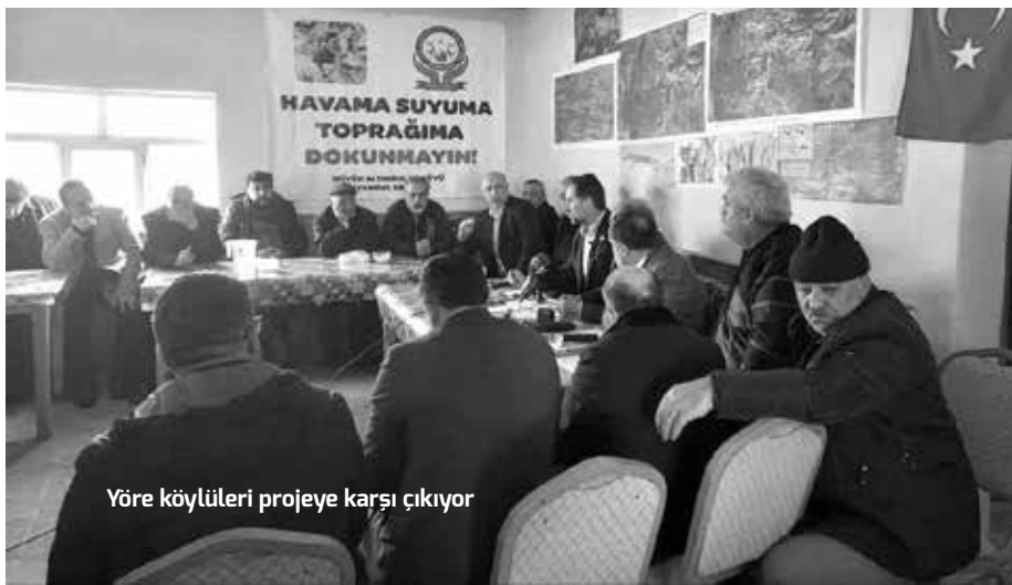
Yöre köylüleri projeye karşı çıkıyor

Yaklaşık 2 milyon m 2 'lik (1.959,15 ha) ruhsat sahasına sahip olan altın ve bakır madeninde ilk etapta 150 bin m 2 'lik alanda açık ocak işletmesi açılması planlanıyor. Proje kapsamında 18 bin m 2 'lik geçici cevher depolama alanı ile 20 bin m 2 'nin üzerinde bitkisel toprak