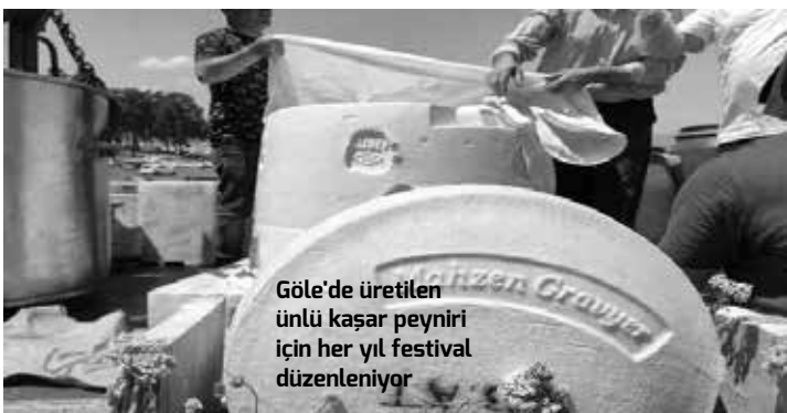
Gölü'de üretilen ünlü kaşar peyniri için her yıl festival düzenleniyor

"TARIMA ELVERİŞSİZ ARAZİ" TANIMI Projeyle ilgili hazırlanan ÇED başvuru dosyasında, maden işletmesi açılması planlanan arazinin toprak işlemeli tarıma elverişsiz olduğu görüşüne yer verilerek şöyle deniliyor: "Proje alanının arazi kullanım kabiliyeti; VI: Toprak işlemeli tarıma elverişsiz araziler vassındadır. Proje alanı arazi varlığı haritasında yapılan çalışma sonucunda mera alanında kaldığı gözlemlenmektedir."