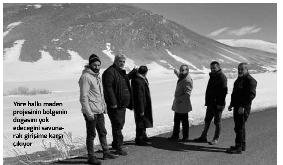
Yöre halkı maden projesinin bölgenin doğasını yok edeceğini savunarak girişime karşı çıkıyor

Projeyle ilgili ÇED raporunda alandan çıkarılacak malzemenin Gümüşhane'ye taşınacağı yönündeki bilginin kandırma-cadan ibaret olduğu görüşünü savunan Işık, Erzincan İliç'te de benzer bir durum yaşandığını dile getirdi. Altın ve bakır madeni projesiyle ilgili 24 Şubat 2024 tarihinde Gölü ilçesinde basın açıklaması yapmak istediklerini ancak yetkililerin izin vermediğini de dile getiren Işık, kendilerine seçim sürecine zarar verilmemesi yönünde bir gerekçe gösterildiğini söyledi. ■ YUSUF YAVUZ