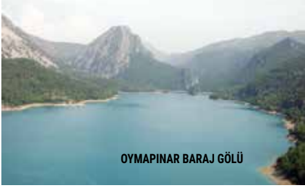
OYMAPINAR BARAJI GÖLÜ

Manavgat ilçesi adını Manaua'dan alır. Notitia Dignitatum adı verilen Roma İmparatorluğu kayıtlarında Manaua, piskoposluk makamı olarak geçer. Anadolu'yu bir uçtan bir uca dolaşan Arkeolog William Mitchell Ramsay, Piskoposluk makamı Manaua'ya Akseki'nin Kepez Köyü civarında yer verir. Manaua'nın